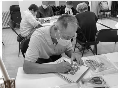
居民制作剪纸作品