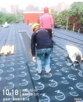
工人在房顶铺设防水层

水等现象。随后,施工方对全楼的上下水管线进行更换,并在所有卫生间内涂刷防水涂层,铺设防滑瓷砖。垂杨柳中里13号楼属于平层,近年来许多居民反映楼顶防水破裂,当室外下大雨时,屋内就会下小雨。此次施工还对楼顶防水油毡等进行统一更换,涂刷新型防水涂料。