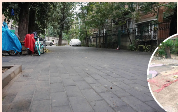
垂杨柳东里 6、7 号楼北侧改造前后