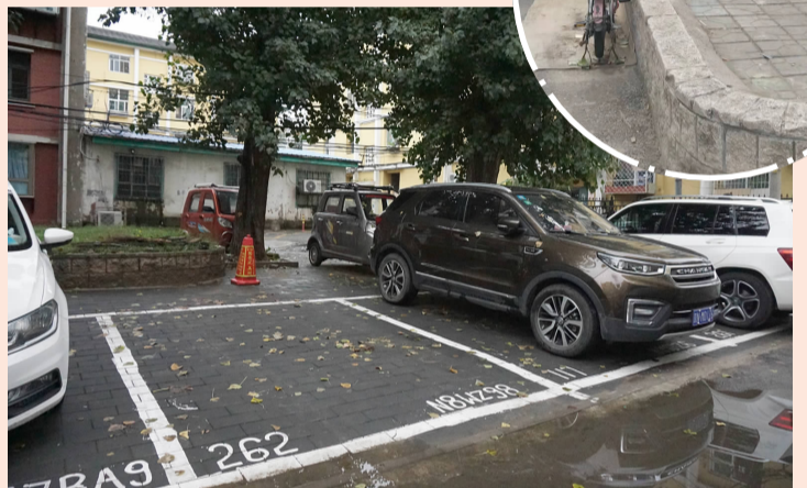
垂杨柳北里 23 号楼南侧路面新增停车位