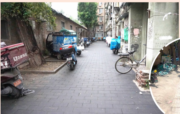
垂杨柳北里甲 6 号楼南侧路面改造