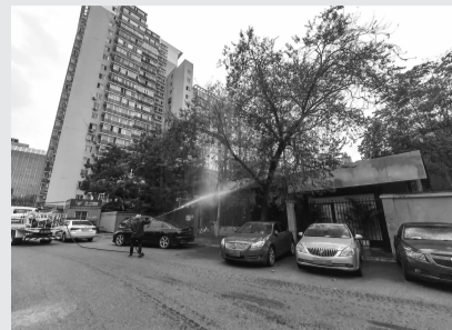
九龙南社区对树木喷洒药物