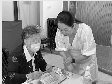
手工老师教居民制作皮影戏