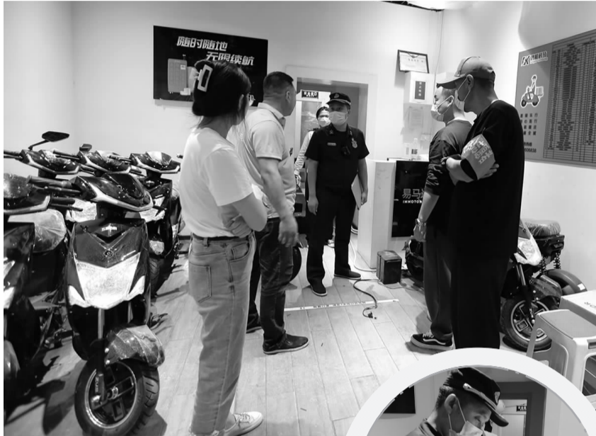
工作人员检查电动车经营场所

居民楼内放置了多个电动车电池，电池极易引起火灾，十分危险。接着执法人员又在垂东社区发现有居民在消防通道堆砌废物的现象，废物所占面积较大，严重堵塞了消防通道。为消除安全隐患，执法人员立即与商户、居民进行沟通，讲解了这种行为可能造成的危险后果，并向商户和居民普及消防知识，进行安全提醒，最终得到了居民的理解。同时执法人员对上述问题做了认真登记，要求其及时清理，“我一定立刻清理掉，以后一定注意。”商户和居民纷纷表示配合。