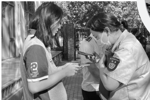
查看商户电子版营业执照